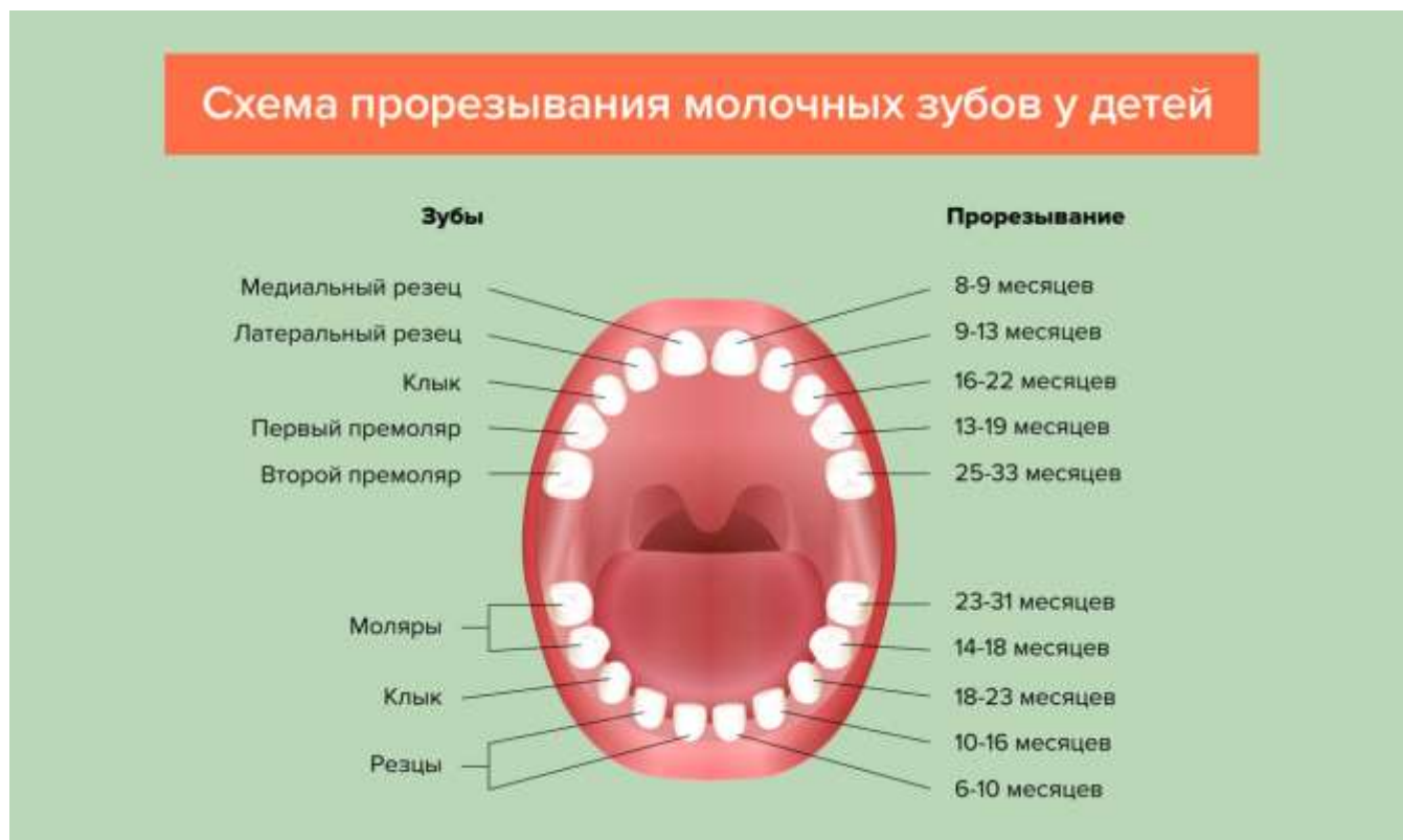
Схема прорезывания молочных зубов